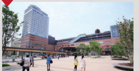
大分市末広町1丁目

幸一が桑原、森と待ち合わせをした大分駅前。映像にも出てくる戦国キリシタン大名「大友宗麟」やキリスト教を布教した「フランシスコ・ザビエル」の銅像があります。